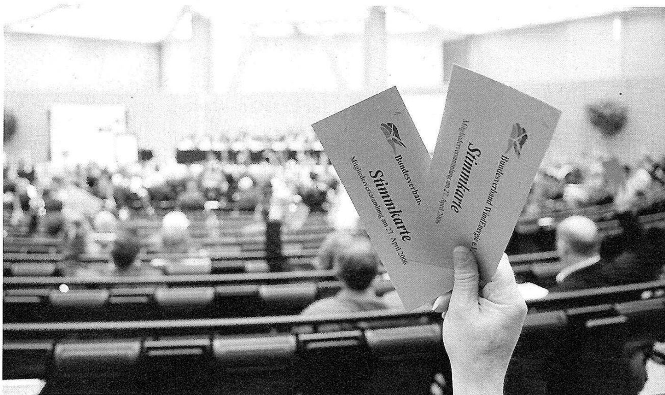
ABSTIMMUNGS-MARATHON. Auf der Jahreshauptversammlung des BWE stimmten die Mitglieder gegen eine Strukturreform des Verbands. Sie soll erst im nächsten Jahr kommen.