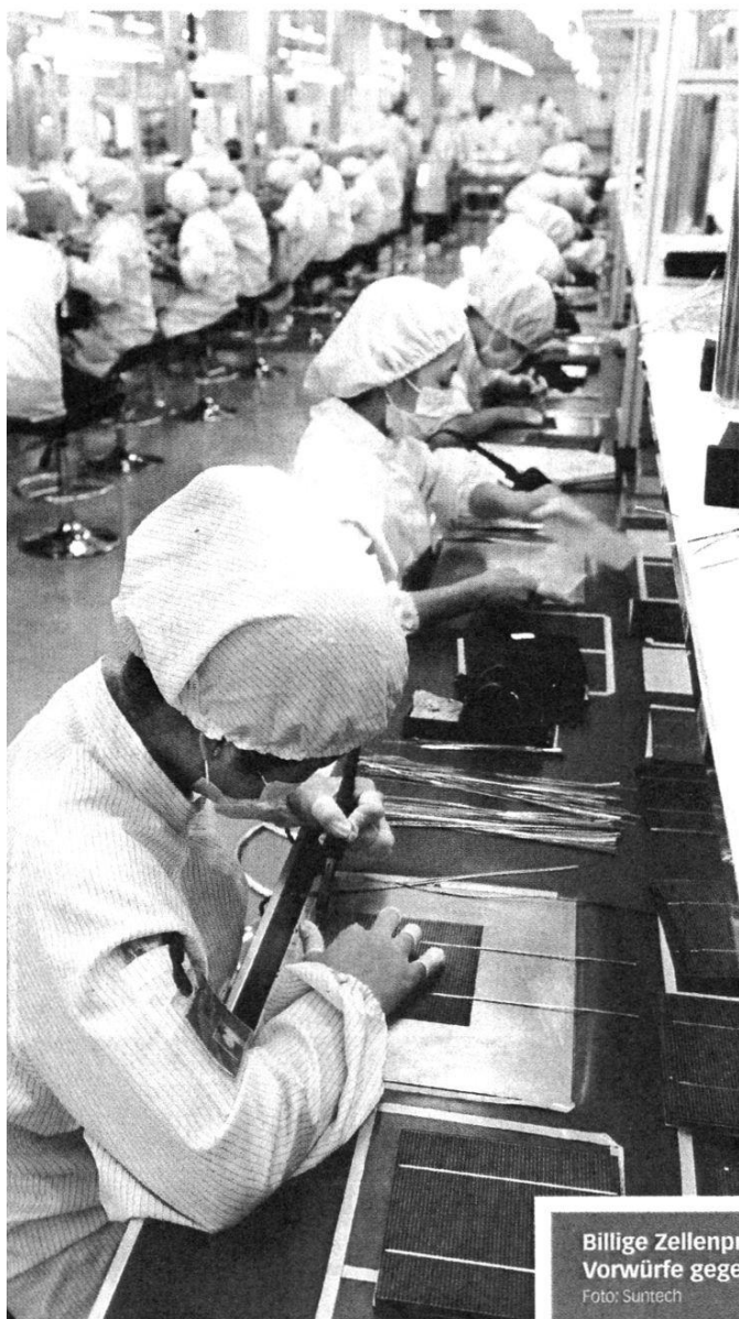
Billige Zellenproduktion in China: Die EU prüft Vorwürfe gegen die chinesische PV-Industrie.

Für die aufstrebenden chinesischen Produzenten wurden sie