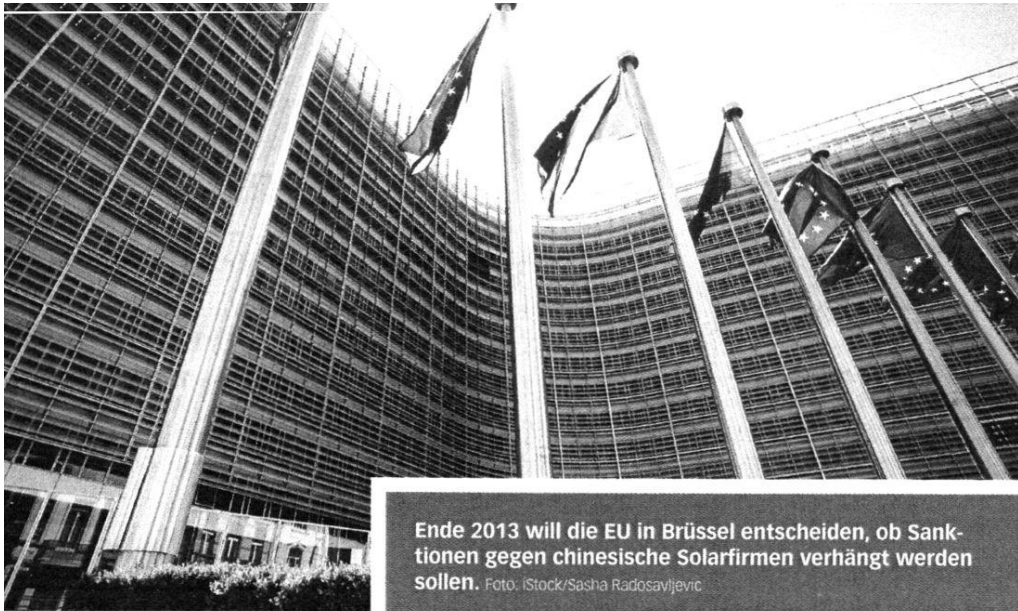
Ende 2013 will die EU in Brüssel entscheiden, ob Sanktionen gegen chinesische Solarfirmen verhängt werden sollen.

Fachinformationsdienst Weltwirtschaft und Entwicklung.