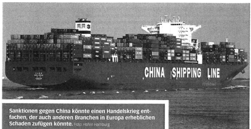
Sanktionen gegen China könnte einen Handelskrieg entfachen, der auch anderen Branchen in Europa erheblichen Schaden zufügen könnte.